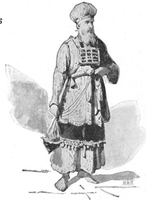
HIGH PRIEST IN ROBES AND BREASTPLATE. —Lev. viii. 8.

▲ (h) ¿Necesitas vestir con ropas especiales y hacer ceremonias y rituales especiales para hacer una pregunta a YHVH? Cuando el sumo sacerdote tenía que hacer todas estas cosas, ¿qué crees que YHVH estaba tratando de enseñarle al pueblo? ¿Por qué no es necesario hacer todo eso ahora? ¿Cómo le llamamos a hablar con YHVH y hacerle preguntas? ¿Por qué podemos ir a hablar directamente con nuestro Padre Celestial, mientras que los israelitas tenían que ir a través de un sumo sacerdote para hablar