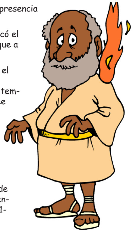
La unción de la Presencia de YHVH en el Día de Pentecostés